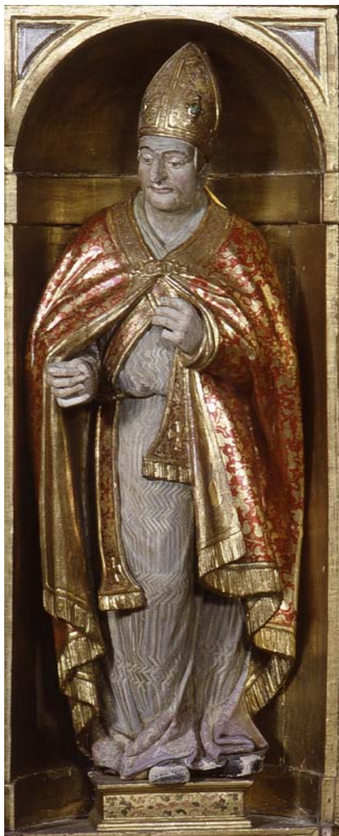
San Carlo Borromeo, particolare dell'ancona del Rosario di Mazzo di Valtellina.

Dunque, come sono visti da Milano la Valtellina e i Contadi? Direi che la prospettiva è ancor oggi fondamentalmente la stessa: come una zona di confine. Colpisce infatti constatare quanto sia lontana di fatto anche ora questa Valtellina, anche se Milano città è poi posta ad una distanza oggettivamente rilevante. E non meraviglia dunque il senso di estraneità che va forse crescendo parallelamente al larvato rimpianto per un passato esecrato, ma che da lontano non appare più così terribile.