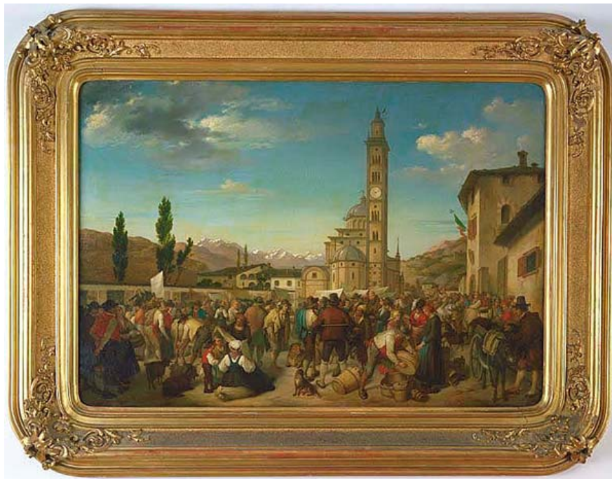
Dipinto di Antonio Caimi raffigurante la fiera di Tirano, 1860.

Durante la stessa le merci potevano essere vendute in esenzione di ogni dazio e i quantitativi di beni venduti durante la stessa, provenienti sia dai territori in questione che dall'esterno – Lombardia, stato veneziano, Tirolo, persino la Francia - erano ingentissimi. Si può calcolare che fossero annualmente compravenduti decine di migliaia di capi di bestiame, vino in ingente quantità, telerie e merci varie di diversa provenienza; per la realtà dell'epoca erano quantità molto importanti, tanto che la fiera divenne probabilmente la più frequentata delle Alpi centrali.