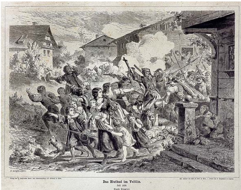
Incisione con la strage dei protestanti del 1620. Tirano, Museo etnografico tiranese.

E vorrei indicare a questo proposito almeno un paio di piste. Credo che, innanzitutto, manchino indagini prosopografiche sulle famiglie valtellinesi che ci consentano di capire come davvero esse si muovessero anche nei confronti dei grandi mutamenti politici del tempo: quali ne fossero le fonti di reddito; se fossero avvantaggiate o al contrario colpite dalle condizioni poste dai nuovi governanti; se e quali alliances si fossero costituite di fatto e, poi ancora, come vivessero le divisioni religiose.