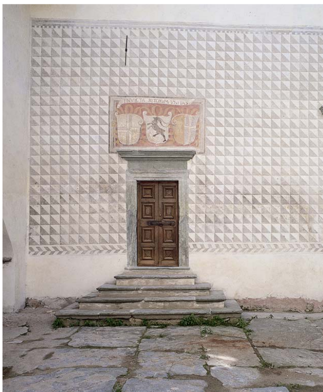
Stemmi delle Tre Leghe sopra il portale del salone delle feste di Palazzo Lavizzari a Mazzo di Valtellina.

Vero e proprio modello storiografico perché esso appare esemplare da diversi punti di vista, e in particolare da quello della definizione e decisione “politiche” di realizzarla, delle sue impostazione e realizzazione “scientifiche”, della qualità intrinseca dei contenuti e del loro intento “divulgativo”. La decisione di promuovere una “storia dei Grigioni”, infatti, è stata presa dal Governo cantonale, il quale ha voluto offrire ai propri concittadini, agli studenti, agli studiosi locali e forestieri una visione generale e un'interpretazione complessiva ma anche analitica delle vicende, così singolari e interessanti, delle entità sociali e delle comunità che sarebbero poi divenute il Libero Stato delle Tre Leghe e infine il Cantone dei Grigioni.