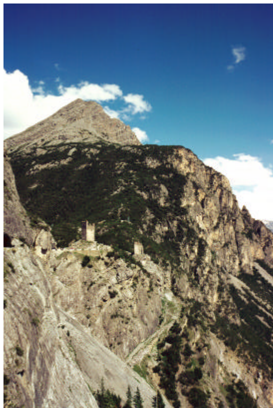
Valdidentro, Torri di Fraele

Gli statuti di Como, dello stesso secolo, prevedevano espressamente che i conducenti vino dal Chiavennasco verso le ultramontanas partes non potessero ricevere aiuto dal comune lariano per danni subiti; i relativi contenziosi dovevano essere risolti direttamente dalle parti o in periferia.