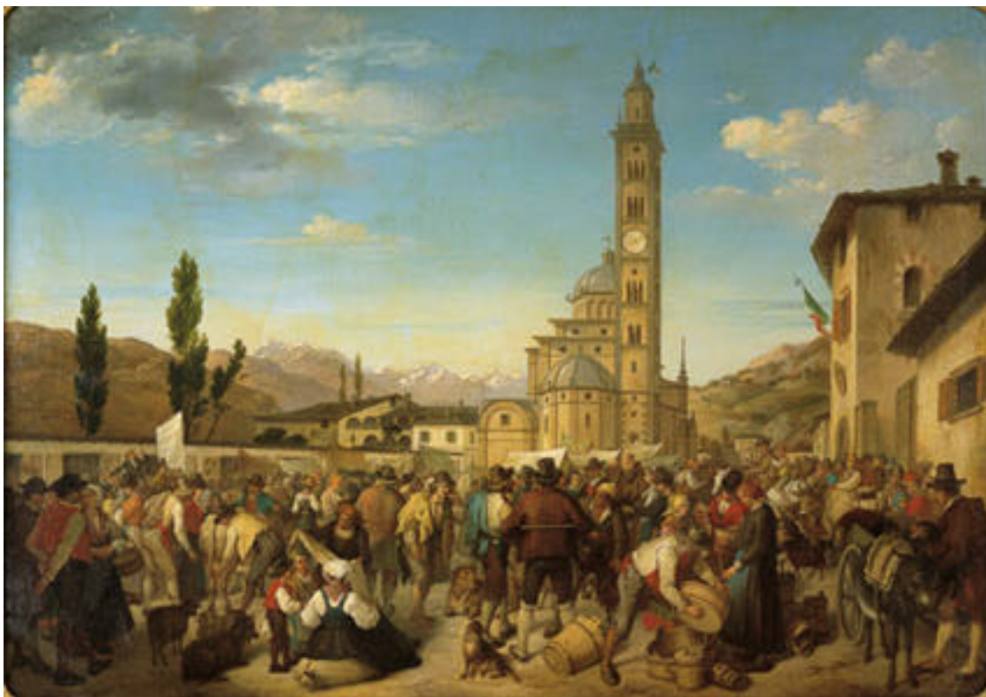
Antonio Caimi, La fiera di Tirano – olio su tela 1860

Immediatamente dopo l'ampliamento del loro Stato con l'annessione delle valli sudalpine i Grigioni avvertirono la necessità di assicurare con le stesse rapporti più facili e continui, ampliando e diversificando nella massima misura possibile le vie di penetrazione.