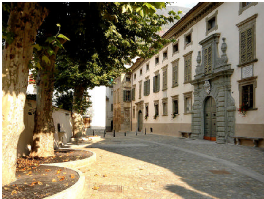
Tirano, Palazzo Sals

Il trasferimento della disponibilità di tanto prodotto dalle mani di una potente famiglia locale a quelle di un Grigione non fu un caso isolato, anche se fu senz'altro eccezionale per le dimensioni, ed è rappresentativo di un processo che fu costante e di notevole rilievo. Si può calcolare che in Valchiavenna, tra Tirano e