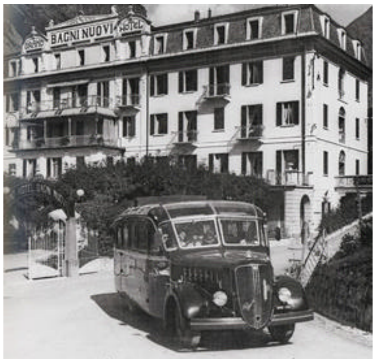
Bormio, Hotel bagni Nuovi, 1937

Il lento processo di formazione della Svizzera moderna, con la non facile integrazione dei Grigioni con gli altri cantoni, e le gravi difficoltà economiche del periodo, dall'una e dall'altra parte, resero ancor più difficile il lento ristabilimento dei rapporti economici; la situazione migliorò, in modo apprezzabile, solo dopo la costituzione del Regno d'Italia, anche per la definizione delle controversie di confine che ancora permanevano e per il superamento della gravissima crisi economica che aveva interessato la