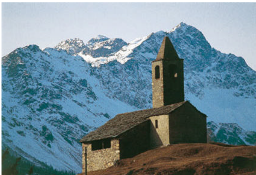
Valposchiavo, Xenodochio di San Romerio

Campocologno, Zalende e Cavaione, attualmente frazioni di Brusio, fecero per lungo tempo parte della comunità di Tirano: Campocologno e Zalende fino al Cinquecento, Cavaione almeno in parte fino agli anni '60 dell'Ottocento. Nei catasti del primo ottocento il territorio di quest'ultima frazione è ancora censito come appartenente al comune di Tirano, al quale erano dovute le imposte